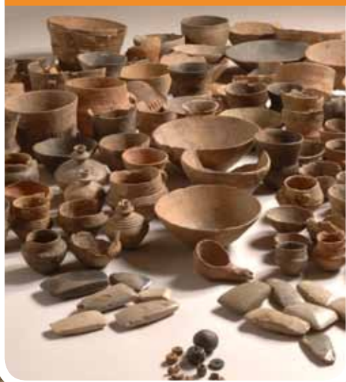
De doden kregen gereedschap, potten en sieraden mee in hun graf.

In Groningen en vooral Drenthe vind je bijzondere stapels stenen. Het zijn hunebedden. Die grote stenen zijn vijfduizend jaar geleden door mensen zo opgestapeld. Waarom? De hunebedden waren graven. Dode mensen werden eronder gelegd. Ze kregen spulletjes mee die ze in het hiernamaals konden gebruiken. De stenen werden bedekt met aarde en zo werden het grafheuvels. Eeuwen later zijn alleen de stenen overgebleven. En wat spulletjes.