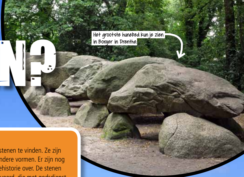
Het grootste hunebed kun je zien in Borger in Drenthe.