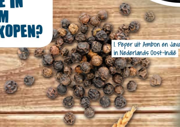
1. Peper uit Ambon en Java in Nederlands Oost-Indië