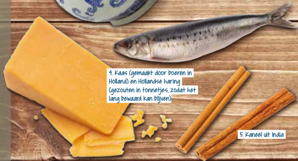
4. Kaas (gemaakt door boeren in Holland) en Hollandse haring (gezouten in tonnetjes, zodat het lang bewaard kan blijven)