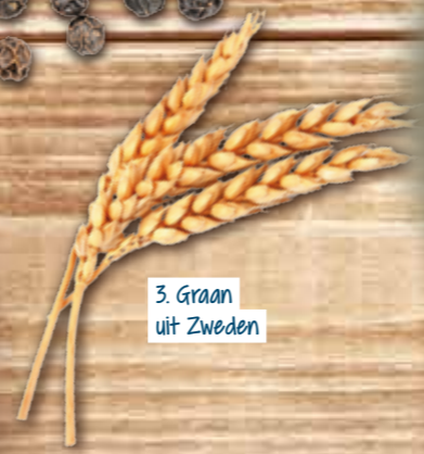
3. Graan uit Zweden