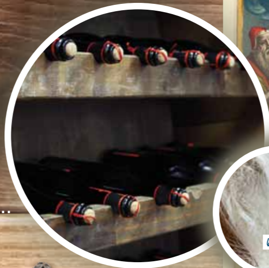
6. Wijn en zijde uit Italië