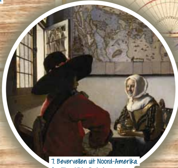
7. Bevervellen uit Noord-Amerika. Op dit schilderij zie je een man met een hoed van beverbont.