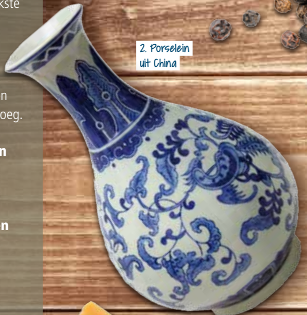
2. Porselein uit China